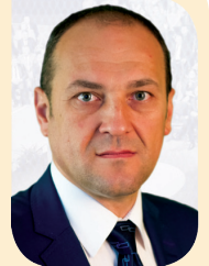
La început de an

Debutul anului 2022 reprezintă un moment de nădejde pentru dezvoltarea localității. Ultimii doi ani au fost dificili pentru Jimbolia, întrucât au fost dominați de neprevăzut. Cu toate acestea am reușit să implementăm proiecte care să aducă plusvaloare.