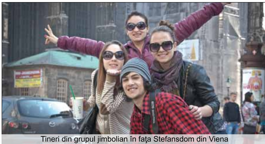
Tineri din grupul jimbolean în fața Stefansdom din Viena

Lucaciu, intersecția străzilor Mihai Eminescu, Spre Sud și Bârzava