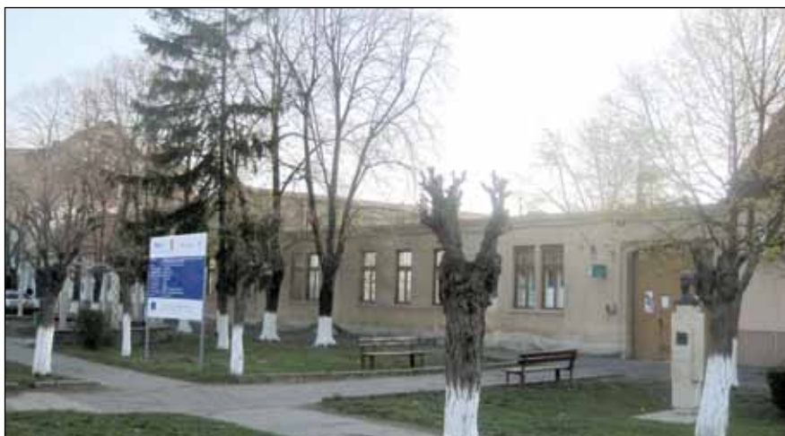
Șantierul de reabilitare a ambulatoriului spitalului (Policlinica)