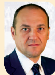
La final de an

Proiectul s-a derulat în cadrul Programului Operațional Competitivitate.