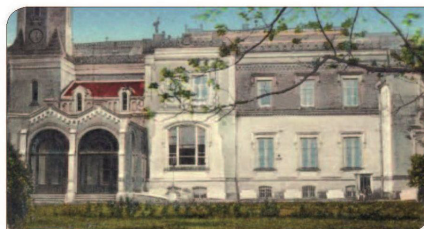
Castelul Csato în anul 1925

îndurat pierderea celor 153 de bărbați căzuți pe front, se vedeau puși în fața unor procese rechizitorii și se confruntau cu probleme de procurare a mijloacelor de bază necesare traiului.