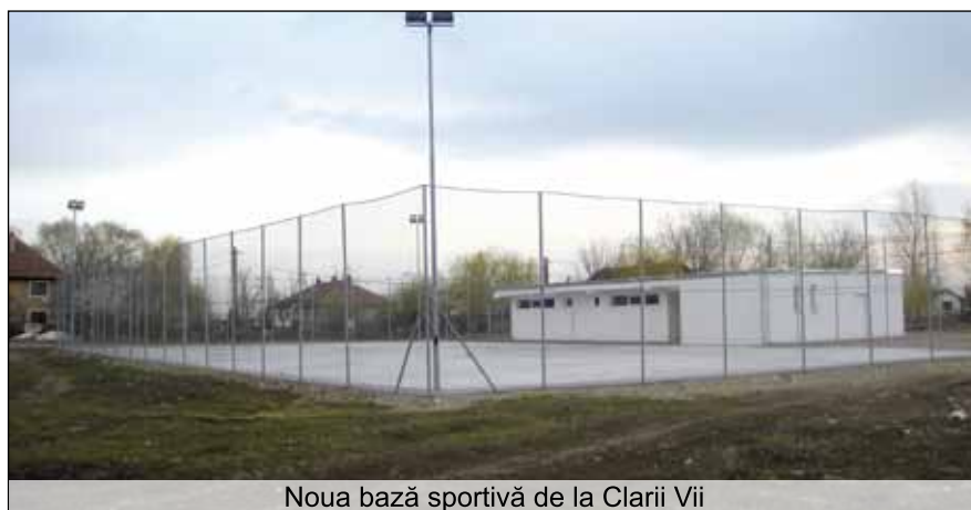
Noua bază sportivă de la Clarii Vii

În săptămâna 2-6 aprilie în școlile din România se desfășoară săptămâna numită „Școala altfel”. Primăria Jimbolia la fel ca în cei 7 ani anteriori a organizat în 3 și 4 aprilie excursia pentru elevii din clasa a XII-a la Budapesta și Viena. Grupul de 83 de elevi și profesori au admirat o panoramă frumoasă de pe Citadela din Budapesta, au vizitat muzee din Viena, au admirat castelele Schonbrunn și Belvedere, s-au plimbat pe Ringul vienez. Mulțumiri sponsorilor