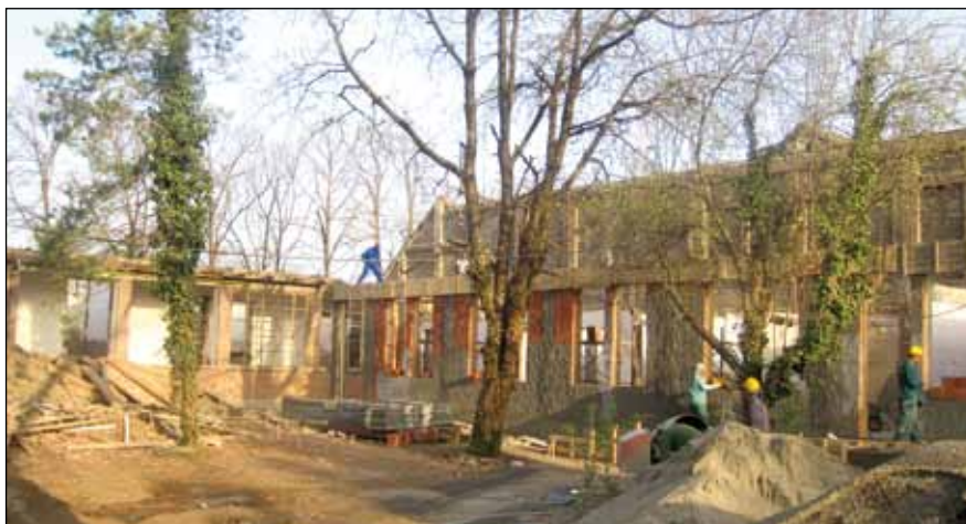
Șantierul de reabilitare a ambulatoriului spitalului (Policlinica)

Lucrările sunt în fază avansată de execuție, constructorul fiind firma Saiftim din Timișoara.