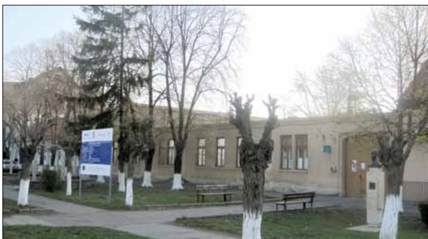
Șantierul de reabilitare a ambulatoriului spitalului (Policlinica)