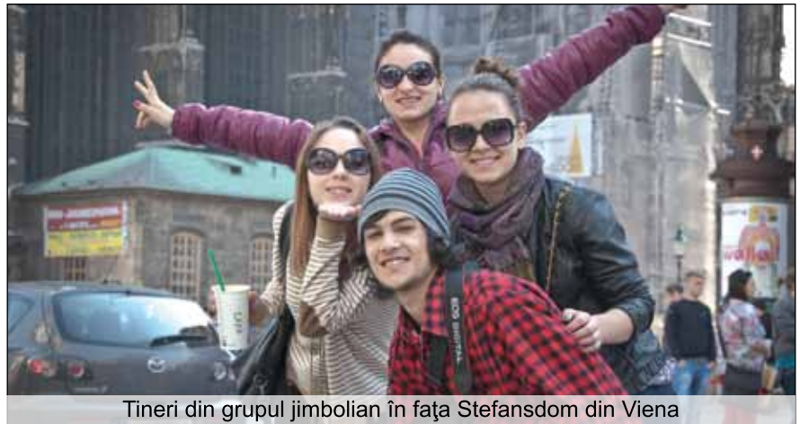
Tineri din grupul jimbolean în fața Stefansdom din Viena

Lucaciu, intersecția străzilor Mihai Eminescu, Spre Sud și Bârzava