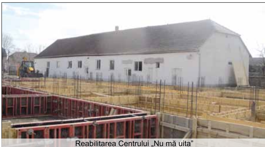
Reabilitarea Centrului „Nu mă uita”

Acest studiu va putea fi folosit și de către firma Mannvit din Islanda, care, în luna februarie, a făcut o vizită în Jimbolia și care intenționează atragerea unui fond guvernamental islandez pentru încălzirea cu apă geotermală a Spitalului, a Liceului, a Școlii generale, a Grădinițelor, a Căminului pentru persoane vârstnice, a Centrului de zi „Nu Mă Uita”, a Policlinicii, a In-